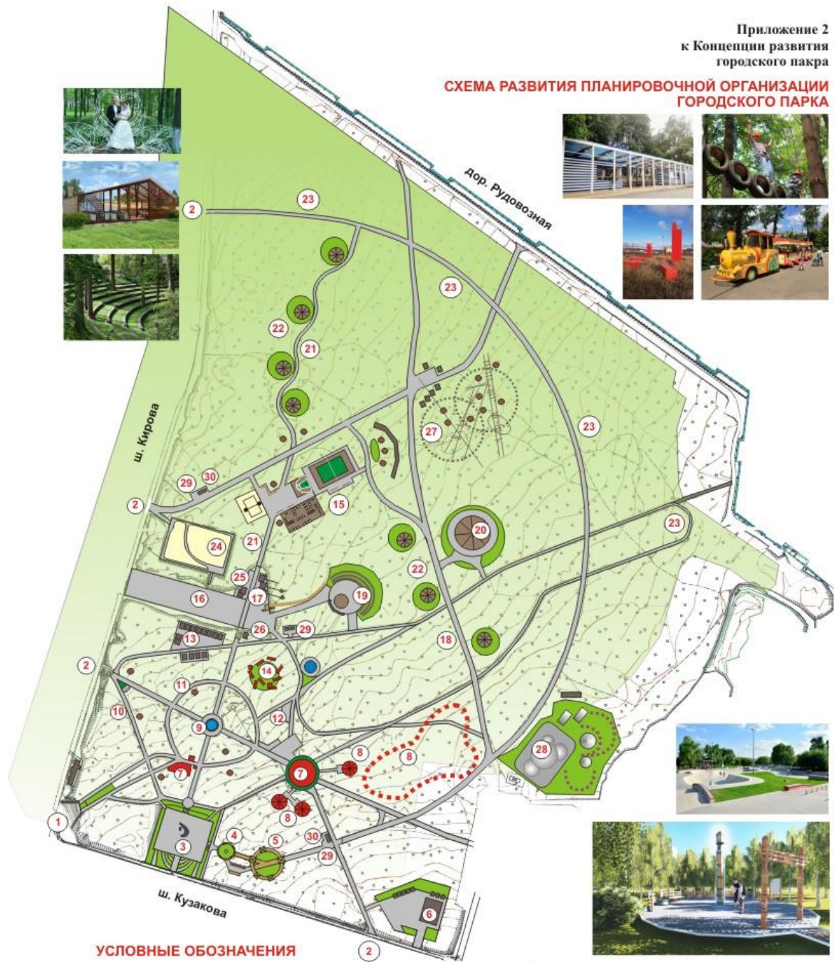
СХЕМА РАЗВИТИЯ ПЛАНИРОВОЧНОЙ ОРГАНИЗАЦИИ ГОРОДСКОГО ПАРКА