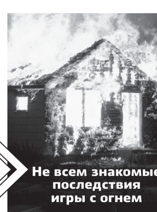
Не всем знакомые последствия игры с огнем

Не включайте в одну электрическую розетку несколько мощных электроприборов!