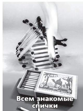
Всем знакомые спички