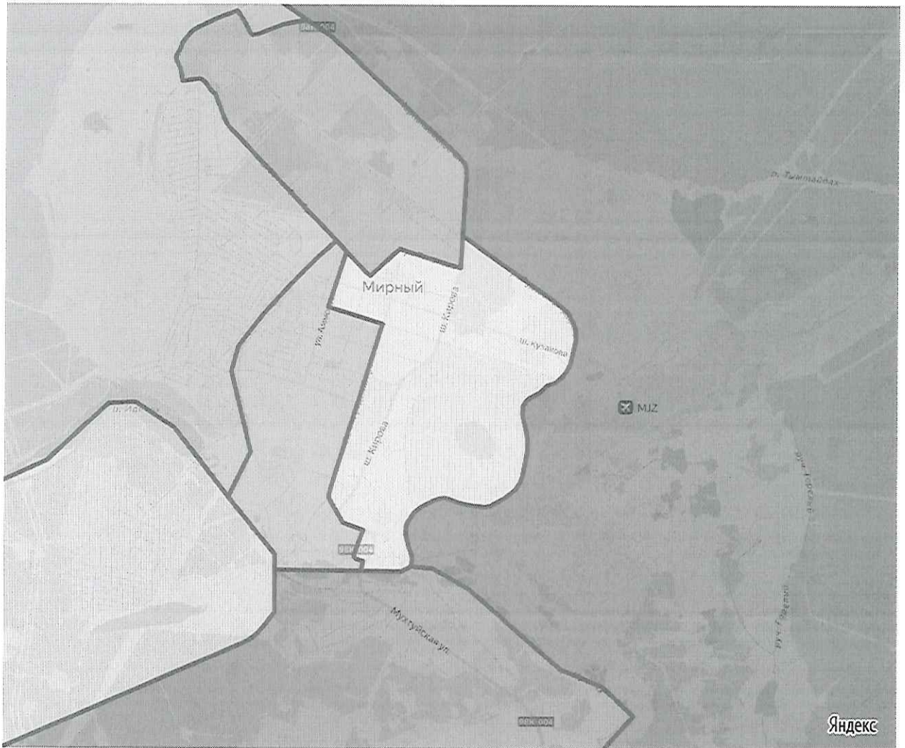
фрагмент графического изображения 2