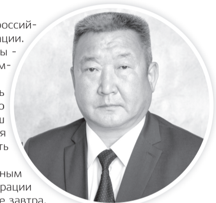
Клим Антонов, Глава города Мирный

Уважаемые мирнинцы! В эти дни решается наша с вами дальнейшая судьба!