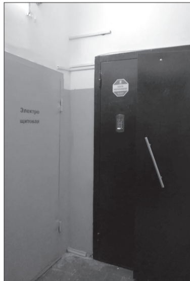
Подъезд дома № 3, улица Солдатова

▶ Хотелось бы выразить огромную благодарность нашей управляющей компании «Экономъ». Молодые, амбициозные, активные – они стараются оперативно решать все вопросы и выполнять пожелания жильцов. Поддерживают в продвижении гражданских инициатив. Желаю компании удачи, процветания и не сбавлять оборотов!