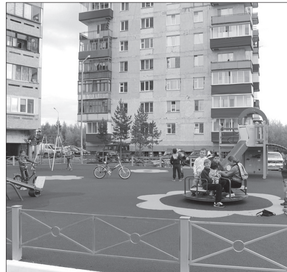
Детская площадка у дома № 14, улица Солдатова